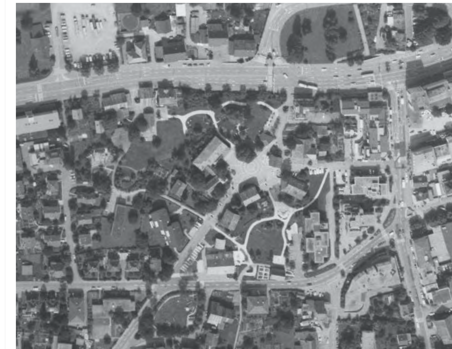
Luftbild 1987 - Mst. 1:2000

Legende: Defizite Stärken weitere Hinweise