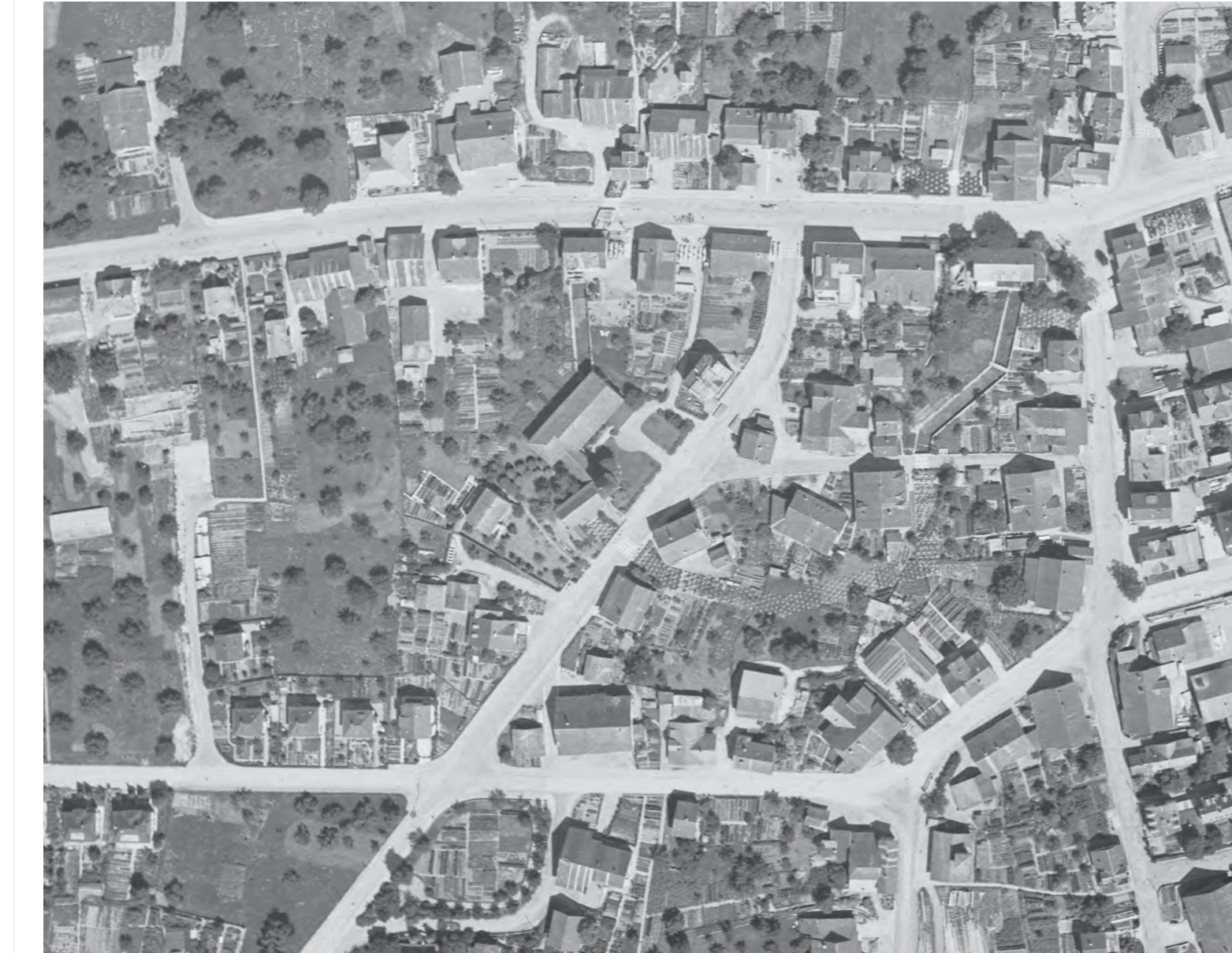
Luftbild 1944 - Mst. 1:2000