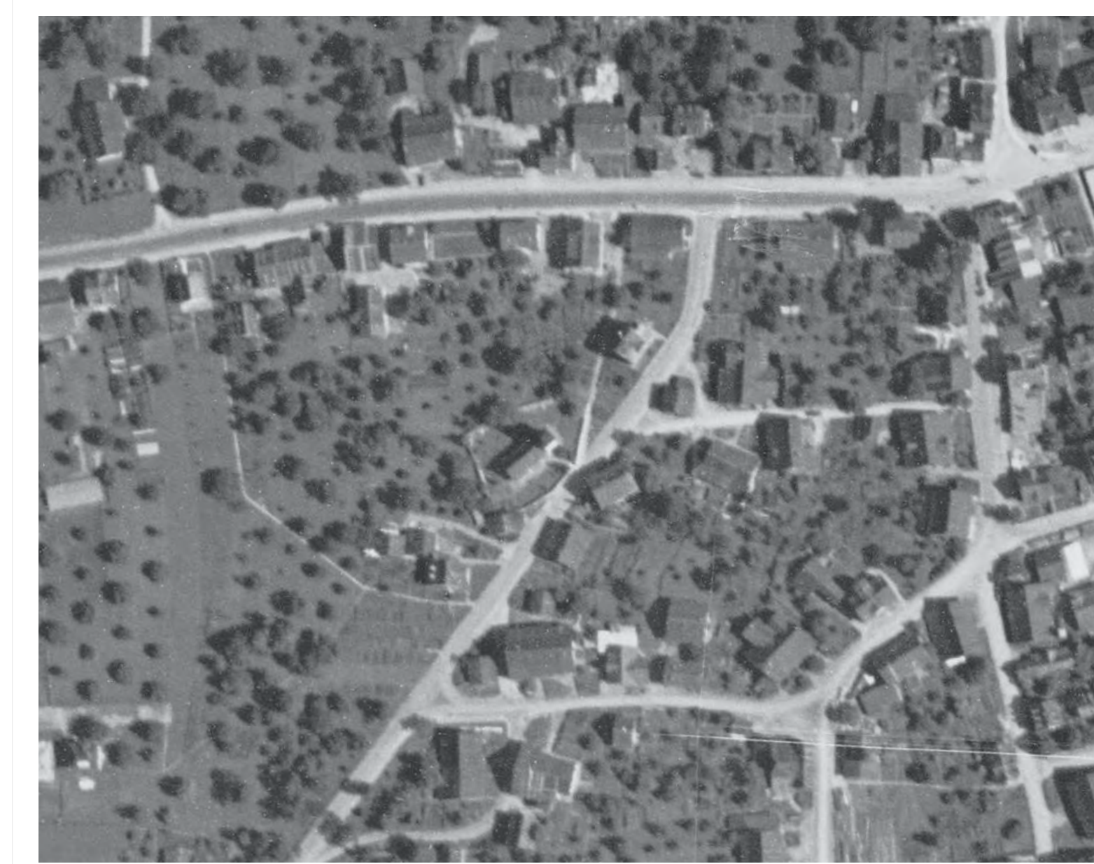
Luftbild 1931 - Mst. 1:2000