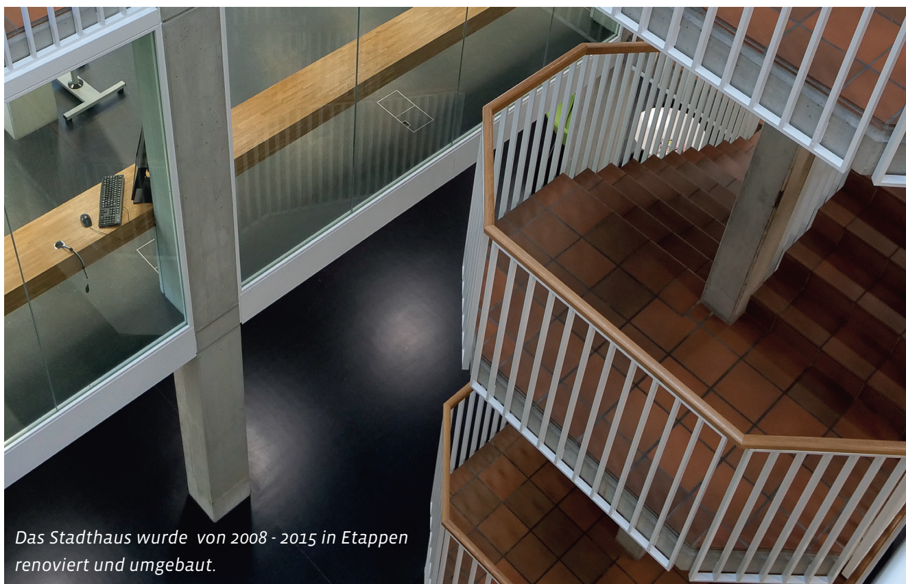
Das Stadthaus wurde von 2008 - 2015 in Etappen renoviert und umgebaut.

folios und der Bewirtschaftung wurden Ziele und Strategien definiert. Ein nachhaltiges und zweckdienliches Immobilienportfolio trägt massgeblich zur effizienten Erfüllung der vielfältigen öffentlichen Aufgaben bei. Die Stadt richtet ihr Immobilienportfolio auf die Nutzungsbedürfnisse aus und berücksichtigt die Lebenszykluskosten sowie den kulturellen Wert einer Immobilie. Die Immobilienstrategie versteht sich als Fachstrategie zur Entwicklung der räumlichen Infrastruktur und beinhaltet eine Vision, eine Mission und ein Leitbild. Sie gilt, mit Ausnahme des Tiefbaus, für eigene als auch gemietete Liegenschaften.