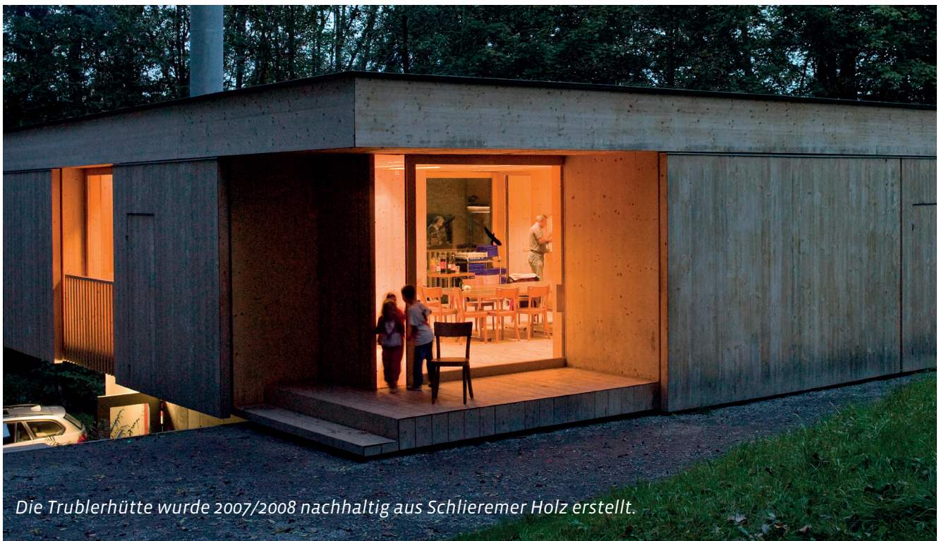
Die Trublerhütte wurde 2007/2008 nachhaltig aus Schlieremer Holz erstellt.

Entsprechend den Bedürfnissen der kommunalen Finanzplanung wird ein Prognosehorizont von einem Jahr (Budgetplanung) bis vier Jahren (Investitionsplanung) abgedeckt. Die Kostenprognosen der Bauverwaltung werden in der Regel jährlich in die kommunale Finanzplanung übertragen. Die Stadt erhält mit dem MPI ein neues Tool, welches auf einfache und praktikable Weise eine langfristige Investitionsplanung des Immobilienportfolios ermöglicht. Auf Grundlage der baulichen und energetischen Anforderungen und der betrieblichen Bedürfnisse werden eine Objektstrategie abgeleitet und entsprechende Baumassnahmen geplant, Immobilienerwerb und Veräusserungen koordiniert und der Investitionsbedarf abgeschätzt.